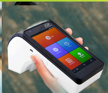
Puntos de Venta