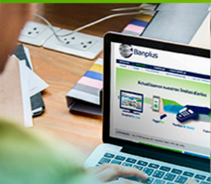
Banplus On Line